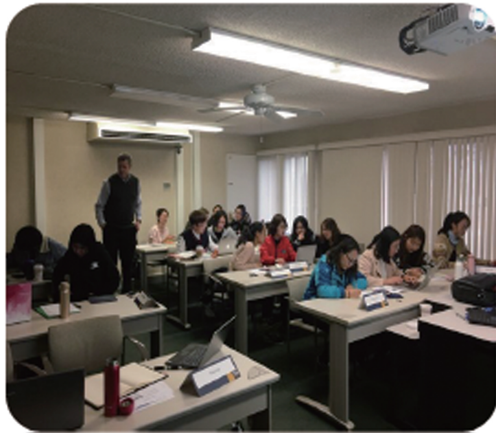
教授为同学们解答问题

我发现同学们听的都很认真，学生也都非常尊重老师，很少有学生玩手机（少数人用电脑辅助听课学习），更不会吃东西。与中国大学不同的是，这里的学生经常会主动提出疑问或新观点，老师也会耐心解答和肯定。而且这里的每位学生手里都有一个答题器，老师每讲完一个知识点会随时在幻灯片上出题，学生用手中的答题器选择答案，正确率就会随时以树状图的形式展现在投影上。我认为，这种师生互动环节也会激发学生更大的兴趣。